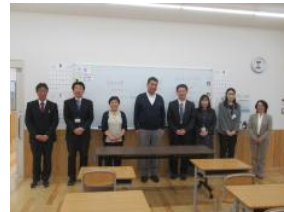
「始めの会」職員紹介の様子です。

新たなスタートを切った皆さんを応援する意で、味なく、全力投球で頑張るといいますが、「本気の気持ち」といって、本気の気持ちがあるのかどうか、自分自身で確かめてください。自分の正直な気持ちに従って、自分自身で、小さなことから一歩踏み出してみます。そして、助けてくれます。でも疲れたり、悩んだりしてまた、本気で取り組んでいきましょう。本気で応援していきます。