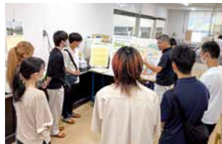
◀市内の施設を見学