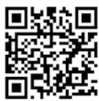
▲未来創生塾ホームページ