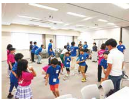
▲コミュニケーション講座