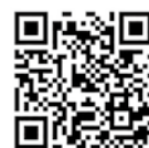
▲申し込みフォーム

問い合わせ＝未来創生塾事務局（桐生商工会議所内、☎45 - 1201）、生涯学習課社会教育係（☎46 - 6465）