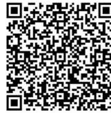
補助制度のページ

受付期間：令和8年4月1日（水）から令和9年1月29日（金）まで 受付場所：SDGs推進課（市役所3階） 受付時間：午前8時30分～午後5時15分 ※先着順で受け付けます。 ※郵送では受け付けできません。 ※土曜・日曜・祝日・年末年始は受け付けできません。 ※事業着手前に交付申請し、交付決定を受ける必要があります。