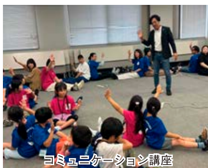
コミュニケーション講座