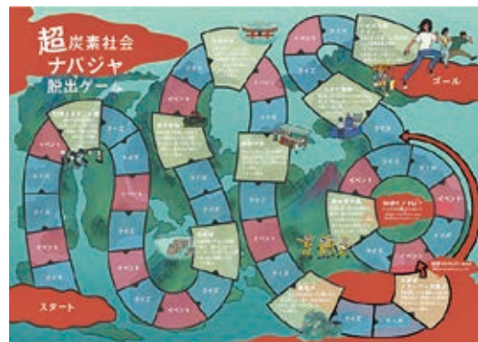
超炭素社会ナパジャ脱出ゲーム

問い合わせ＝SDGs推進課（☎32 - 4200）、群馬県環境森林部環境政策課（☎027 - 226 - 2821）