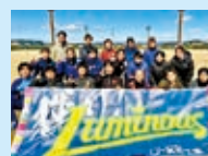
ザスパ群馬ルミナス