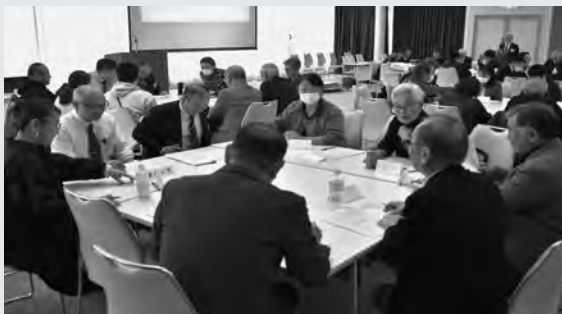
参加者と議員が意見交換をしている様子

令和8年2月28日(土)、美喜仁桐生文化会館スカイホールBにおいて「第37回議会報告会・意見交換会」を開催しました。