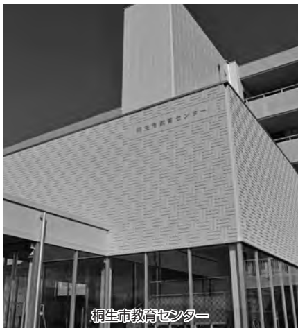
桐生市教育センター

問 新たに教育センター裏校舎に美術館や博物館を整備するスペースは確保できない。また、重要文化財は保存のための空調や防犯、防火体制などの厳しい条件があり、県立歴史博物館へ寄託しているが、耳飾りのレプリカは常時ご覧いただけるよう、絹襷記念会館で展示している。