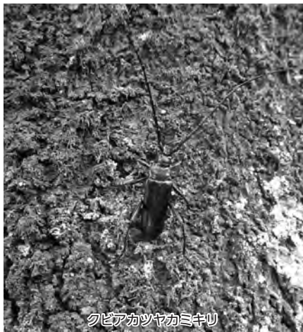
クビアカツヤカミキリ

問 令和8年度の全市有施設におけるクビアカツヤカミキリの防除対策の合計予算額は、約1億1,963万円となっている。また、被害木の予定伐採本数は合計344本となっている。