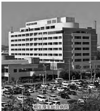
桐生厚生総合病院

問 課題の客観的分析に外部人材活用は 答 現在、厚生病院では、地方公営企業法の全部適用により、病院経営を企業長の強い権限と責任の下で行っているが、組織の健全性を保つていくためには、一般的には、外部の専門的知見を取り入れることは有効と考える。市としては、開設者協議会や経営強化プラン検討委員会等の中で必要な意見を伝えていきたい。