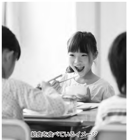
給食を食べているイメージ

そのほか…「経済的な事情に関わらず、こどもたちが多様な学びや体験を得られる仕組みの構築」について質問