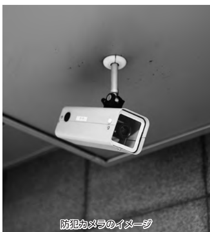
防犯カメラのイメージ

問 今年2月、市内金融機関で強盗事件が発生した際、地元住民は非常に不安な思いをしていた。また、最近の犯罪は凶悪化しているという報道もある。防犯カメラは、市民の生命と財産を守るための施策であり、犯罪を未然に防ぐための社会基盤でもある。また、事件発生後の対応手段としても効果的と考える。本市が安心して暮らせるまちになるため、公共の防犯カメラの増設をしていただきたい。