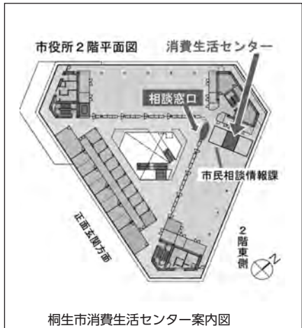
桐生市消費生活センター案内図