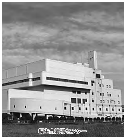
桐生市清掃センター

そのほか…「前橋市、桐生市、伊勢崎市、みどり市及び玉村町ごみ処理の広域化に関する基本合意書」の締結について質問