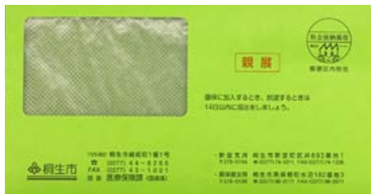
黄緑色の封筒で送ります

マイナ保険証(健康保険証として利用登録がされたマイナンバーカード)をお持ちの人には「資格情報のお知らせ」(A4サイズ)が、マイナ保険証をお持ちでない人と、資格確認書の交付申請をして登録をした人には「資格確認書」(名刺サイズ)が送られます。