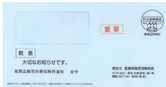
水色の封筒で送ります