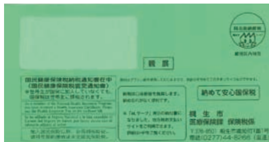
緑色の封筒で送ります